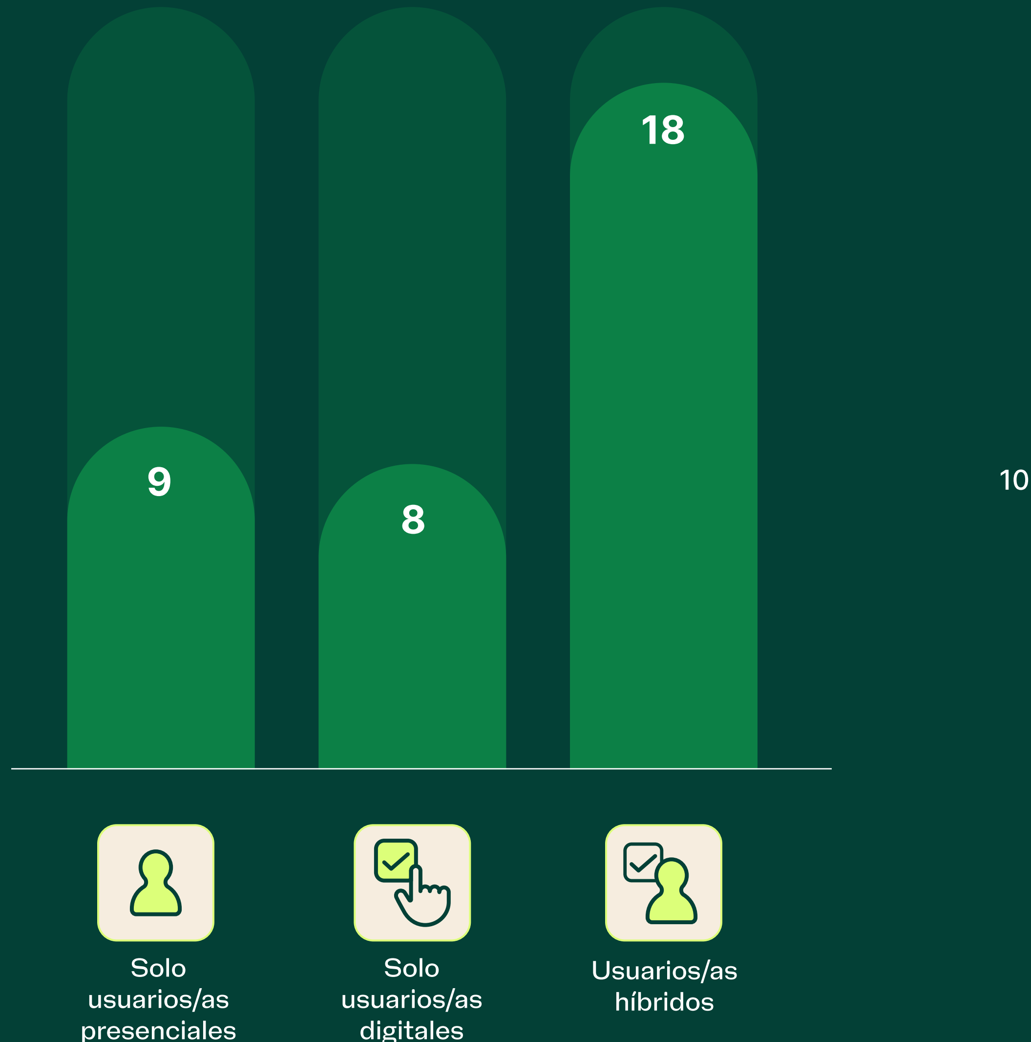
PROMEDIO DE CHECK-INS MENSUALES POR USUARIO/A